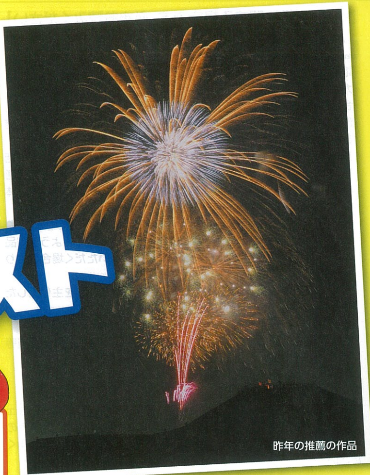
昨年の推薦の作品

平成28年8月21日(日) ぐんま「はにわの里」夏まつり 及び 花火大会写真(場所の特定できるもの)