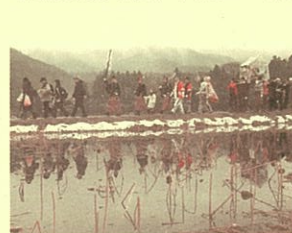
【アンバ様を通る 板荷地区】

◎審査は、鹿沼市を効果的に紹介できるかどうかで判断します。多くの方に鹿沼を好きになっていただくため、あなたのお気に入りの鹿沼を、写真で表現してください。