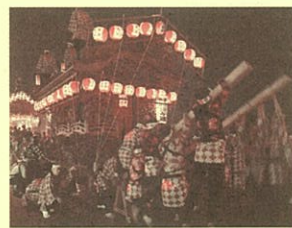
【伝統を受け継ぐ お祭りロード】