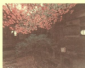
【もみじの頃 屋台のまち中央公園 掬翠園】