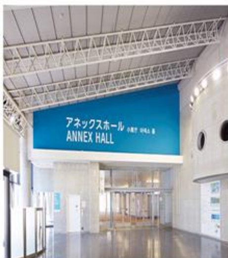
アネックスホール入口