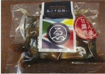
㈱フカコラ美人 「あびす振舞い」の新商品開発を支援し、販路を開拓

【支援結果例 (平成 26 年度)】 ※記者発表資料より http://www.reconstruction.go.jp/topics/20150410_shienseika.pdf