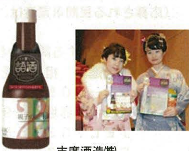
末廣酒造(株) ブランディング支援により、「親子の語酒」シリーズの創設