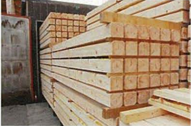
特定非営利法人 自然環境応援団 新製材拠点の整備にあたり、事業計画の策定・資金調達を支援